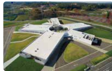
Koji Fujii / ©Nacása & Partners Inc.